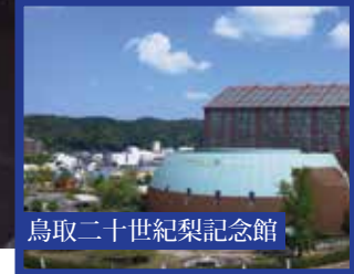
鳥取二十世紀梨記念館