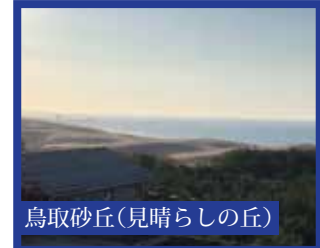
鳥取砂丘(見晴らしの丘)

1泊2日 添乗員同行 旅行代金 [4名以上1室の場合] 大人お一人様 29,800円 [3名1室の場合] (お一人様) 33,800円 [2名1室の場合] (お一人様) 37,800円 旅行代金は、1部屋をご利用になる人数に応じてお支払いいただけます。(グループ単位ではございませんので、ご注意ください。)