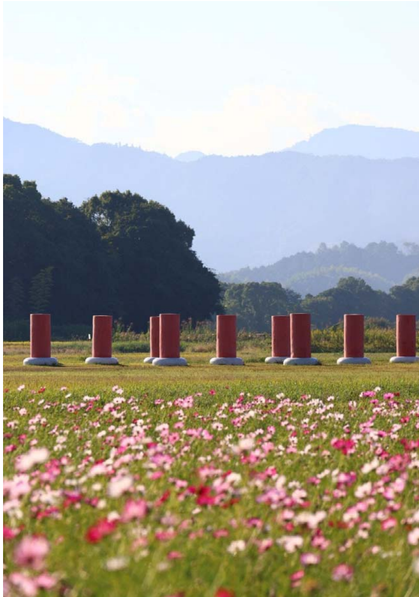
【9月～10月部門】タイトル：「藤原宮跡とコスモス」 撮影場所：橿原市 藤原宮跡